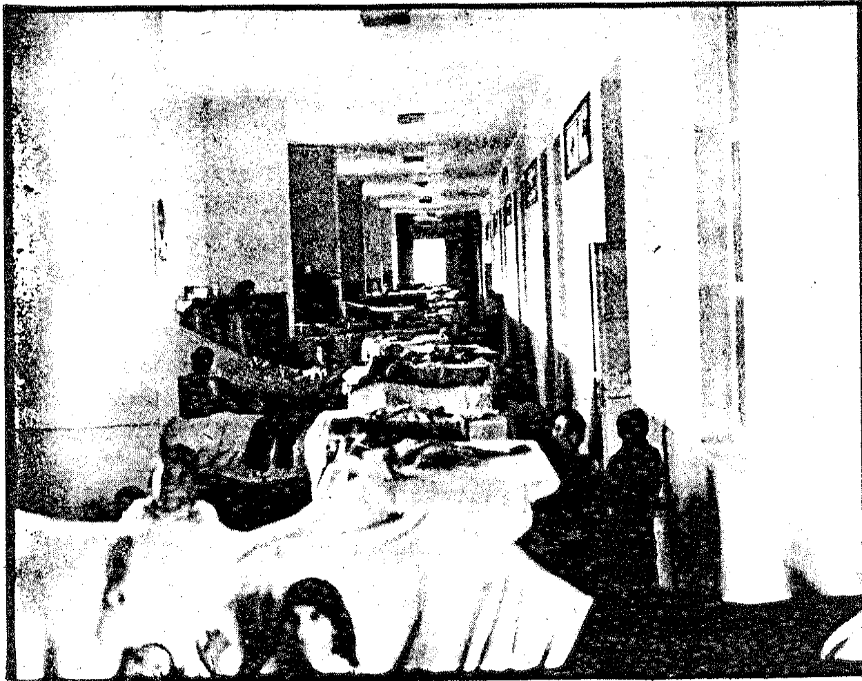
راهرو دبیرستان دکتر شریعتی در بروجرد - میزونی مکتب‌ها را کناره‌م چیده اند و با کشیدن پارچه‌ای بر سر هر قسمت تا قکي درست شده برای یک خانواده.

دولت ضد خلقی عراق، خانه و کاشانه و تمام وابستگی‌های خود را رها کردند و برای حفظ جان به شهرهای امن تشر، روان شدند. در آغاز این آواره‌گی‌ها، مهاجرت‌ها، حکومت جمهوری اسلامی که انتظار چنین برخوردی را از سوی توده‌ها داشت با تبلیغات خود سعی داشت از خروج مردم از شهرهای جنگ زده جلوگیری کند، و آنهایی را که به شهرهای دیگر رفته بودند، و در کنار خیابان‌ها، مدارس، پارک‌ها، و در بدترین شرایط روز و شب آوارگی را می‌گذراندند، خائن، ترسو و... قلمداد کرد و حتی وقاحت را تا به آنجا پیش برد که در شیراز و اصفهان به تحریک اما مجموعه‌های ایندو شهر، و تحریک و راه‌اندازی دسته‌های حزب الهی و فالانژ، به خانواده‌های آواره و جنگ زده یورش بردند، آنها را در مضیقه و تنگنا گذاشتند تا بلکه به شهرهای خود بازگردند. اما واقعیت‌ها و عزم جزم توده‌ها بر آن تراز آن بود که این حرکات فاشیستی بتوانند در آن خللی ایجاد کنند رژیم نیز در قبال این واقعیت، خیلی زود موضع سیاست خود را نسبت به جنگ زده‌ها تغییر داد و به اصطلاح آنها را تحت حمایت خود گرفت و برایشان برنامه ریزی کرد. توده‌های آواره شهرهای جنگ زده در اصفهان، شیراز، بروجرد، خرم‌آباد و... بقیه در صفحه ۱۴