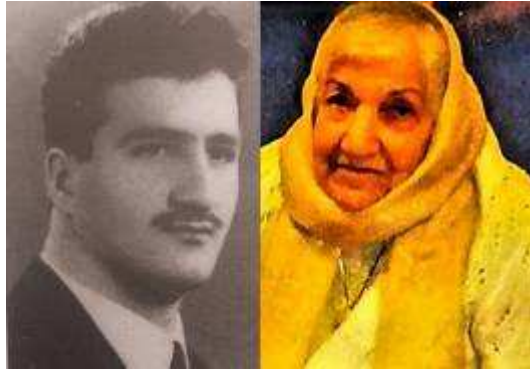
در سوگ مادر ملوک

قطعهنامه محکومیت رژیم با حضور ۱۹۳ نماینده از کشورهای جهان به رای گذاشته شد که ۸۱ کشور آن را تأیید کردند. ۳۷ کشور به این قطعهنامه رای منفی و ۷۶ کشور نیز رای ممتنع دادند. بنابراین، آن اقلیتی که رای منفی داده اند و نمونه های آن دیکتاتورهای سوریه، روسیه، چین و سودان هستند، البته "انگیزه های سیاسی" دارند، زیرا تاکنون از قیل نقض حقوق مردم ایران به چپاول گری و پیشبرد اهداف و منافع سیاسی - اقتصادی خود پرداخته اند. در این گیرودار برخی از دولتهایی هم که خود عامل نقض حقوق بشر هستند و یا منافی در معاملات سودمند با رژیم دارند، بز دلانه پشت رای ممتنع مخفی شده اند. اما مهمترین موضوعی که نماینده جمهوری اسلامی بدان به صراحت اشاره نکرده این