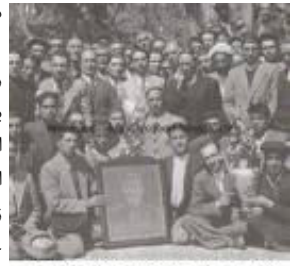
عضو انجمن فدائی در اجتماع سورهان هیر، حامی از حامیان سابق

از جمله مواردی که در بررسی یکسال حکومت ملی آذربایجان بایستی بدان پرداخته شود، نخست ارتباط مقوله ناسیونالیسم با انترناسیونالیسم پرولتری، و تسلط استالین و باقراوف بر کمیته ایران است. مهم تر از