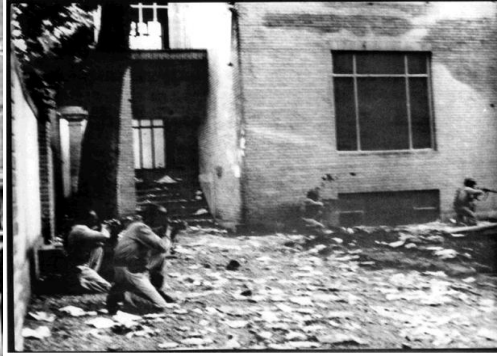
The Shah's troops at the looting of Dr. Mossadegh's house, August 19th, 1953