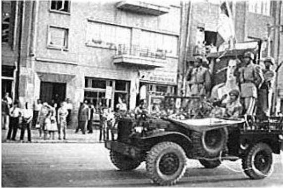
The coup d'état makers (the Shah's troops) carrying the portrait of the Shah, August 19, 1953