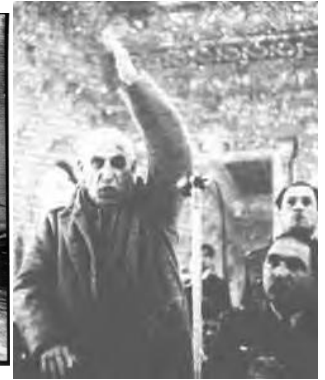
Dr. Mohammad Mossadegh in trial by the Shah, 1953