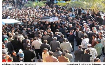
صحنه‌ای از مراسم تشییع جنازه‌ی ۸ تن از جانب‌باختگان معدن طبس

در روز ۲۸ آذر ماه، ۸ کارگر زحمتکش بر اثر انفجار گاز در عمق ۵۰۰ متری در معدن زغال سنگ طبس جان خود را از دست دادند. اخبار این حادثه‌ی هولناک به سرعت در سراسر ایران از طریق شبکه‌های اجتماعی و زبان به زبان پخش شد و زحمتکشان ایران را به سوگ نشاند. حزب کار ایران (توفان) این فاجعه‌ی دردناک را به خانواده‌ی قربانیان تسلیت گفته و خود را در غم این عزیزان شریک می داند. ما همدردی عمیق خود را به همکاران این جان باختگان و زحمتکشان ایران ابراز می داریم. به روشنی پیداست که آمار حوادث کار در سراسر ایران سیر صعودی داشته و شرایط کار برای کارگران هر سال بدتر شده است. در سال ۱۳۹۰، بر اثر حوادث کار تعداد بیش از ۱۲۰۰ کارگر جان خود را از دست داده و بیش از ۲۰ هزار نفر مجروح و بعضاً دچار نقص عضو شده‌اند. کارگران و مردم ایران می دانند که فقدان امکانات ایمنی، شرایط بد کار و فشار طاقت فرسا به کارگران برای افزایش شدت کار از جمله علل اصلی وقوع سوانح در محیط کار هستند. به طور مشخص، کارگران معدن زغال سنگ طبس در مورد بدی شرایط کار و غیر امن بودن معدن، بارها به کارفرما و مقامات هشدار داده بودند. در بررسی سوانح کار، کمتر موردی می توان دید که علت اصلی آن بی توجهی کارگر به مسائل ایمنی بوده باشد.