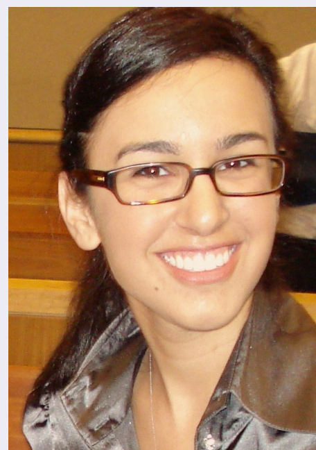
By: Roxana Mehrfar

Zoroastrian influences on inter-state relationships are far more expansive than simply twentieth century political theory. Traveling backwards 2,500 years and shifting focus to the time of the Achaemenid Empire will reveal that Zarathushtra's ideas were instrumental in the conception of universal human rights. During a time when the world was consumed with conquest, imperial expansion, and slavery, the Achaemenid Empire under the leadership of Cyrus the Great adopted tolerant rule over its multi-ethnic subjects and abolished forced labor with the Cyrus Cylinder 2 . Ancient inscriptions and carved reliefs, like the Behistun inscription, strongly support the fact the Achaemenids were followers of Ahura Mazda, and as early Zoroastrians they implemented policies supportive of the natural rights given to man. After the conquest of Babylon in 539 BCE, King Cyrus allowed the sacred Esagila festival 3 to resume in Babylon - a festival that the Babylonian people and priesthood had been denied by their own king for many years, depriving them of their most important annual religious ceremony. In addition to granting the Babylonian people the freedom to practice their own religion, the Achaemenid kings are credited in the books of Ezra and Nehemiah of the Old Testament for freeing the Jewish people of slavery, allowing them to return to Jerusalem from exile, and help-