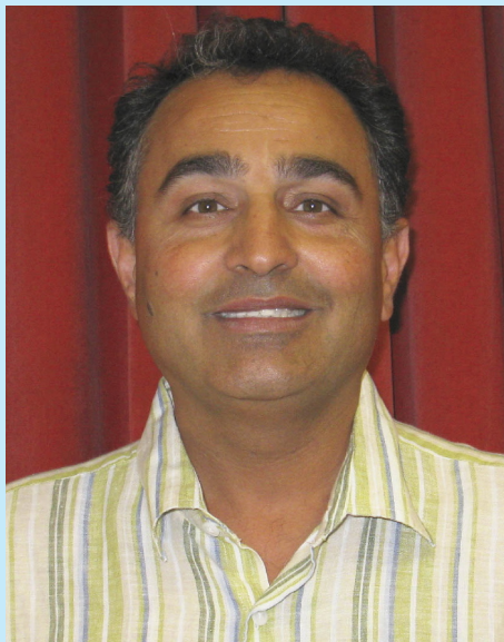
از: مهرداد مهریز

راهبری می‌کند. پس از مرگ هر کس، فروهر او با همان چهره نخستین به ریشه‌ی خود برمی‌گردد و به جاودانگی می‌پیوندد. زرتشتیان برای فروهر نگاره‌ای ساخته و آنرا نشانه‌ی دین زرتشتی کرده‌اند. هر بخش از نگاره‌ی فروهر معنی ویژه‌ای دارد. بدینگونه: ۱- پیرمرد، نشانه‌ی پیری جهان دیده، دانا و رسا می‌باشد. ۲- دست‌های افراشته، نشان نیایش به درگاه اهورامزدا است. ۳- حلقه‌ی در دست، نشان پیمان با خداوند یکتا می‌باشد. ۴- بال‌های گشاده و سه لایه، نشانه‌ی اندیشه، گفتار و کردار نیک است که به کمک آن انسان به رسایی و بالایی می‌رسد (ماز بالاییم، بالا می‌رویم). ۵- دایره‌ی میان نگاره، نشان بی‌پایانی روزگار و برگشت کردار انسان به خود او می‌باشد. ۶- دو رشته‌ی آویخته نشانی هستند از منش پیش برنده و نیک (سپنتامینو) و منش کاهنده و بد (انگره مینو) که زاینده اندیشه‌ی آدمی است. ۷- دامن سه لایه، نشان بدانندیشی (دژمت)، بد گفتاری (دژ هوخت) و بد کرداری (دژ ورشت) هست که باید به زیر افکنده شوند.