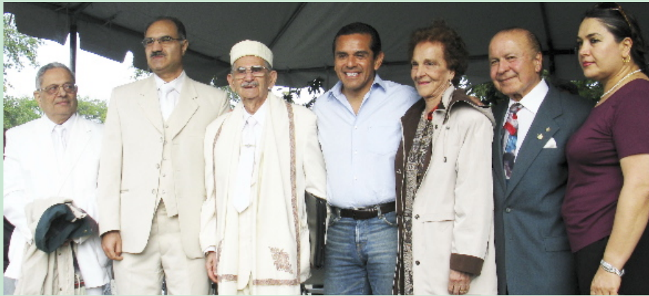
دیدار شهردار لس آنجلس آقای آنتونیو ویراگوسا با موبدان مرکز زرتشتیان کالیفرنیا و همراهان فرنواز: اردشیر باغخانیان

زده شد. شمار زیادی از پیر و جوان آنجا بودند. برخی سرگرم رقص و پایکوبی بودند. گروهی زنبیل بدست دنبال یک جای خوب برای نشست می گشتند، شماری هم جا پیدا کرده بودند و به تماشای غرفه ها رفته بودند.