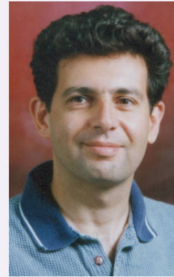
By: Shahriar Shahriari

two very different things. But what you loved about both of them was the digging.