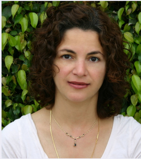
By: Fariba Pirghaibi

Who is a Zartoshti? Am I one because I was born to Zartoshti parents or had a grandfather who was a Zartoshti mobed? Is my atheist neighbor one, who lives the Zartoshti principle but has never heard of Zarathushtra? Is my friend one, who puts the kushti on her sedreh and prays 5 times a day? Or is it my long lost cousin, who has lived her life by the gathic message but never stepped foot inside a fire temple? How about the 16 year old eager young student who is devouring every thing she can get her hands on to learn about and live Zarathushtra's message but wasn't born a Zartoshti? Or is it my coworker whose grandfather on one side was a Zartoshti? Which one of us is more of a Zartoshti than the rest?