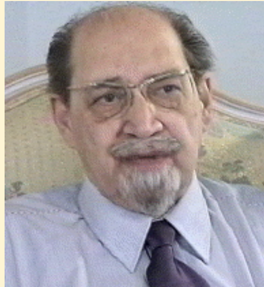
By: Professor Kaikhosrov D. Irani

contemporary humanist ethics. Such views emerge from two misconceptions: i) This is not an ethic based on social norms, it is rooted in an Ideal Righteous Order of Divine origin, Asha. ii) The religion of Zarathushtra is the life of Ethical Commitment. It has been known from ancient times as the Religion of the Good Life, or the Religion of Good Conscience. This is not a religion of supernatural drama, not one of pure submission, nor one of comfort or rest, but one of responsibility for instituting the Right.