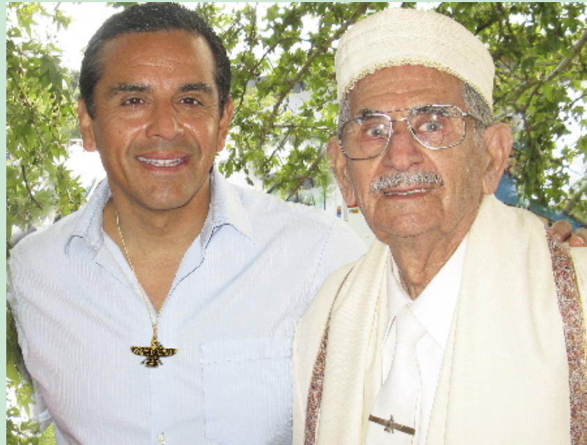
دیدار شهردار لس آنجلس آقای آنتونیو ویراکوسا با موبد شاه بهرام شهزادی در سیزده بدر

این برنامه با هماهنگی آقای موبد دکتر رستم وحیدی گردهم آمده بود. در این گردهمایی از موبدان، موبد یاران و آموزگاران دعوت شده بود تا در این نشست در مورد علاقه مندی جوانان و تشویق آنان به موبدی سخن گفته شود. سالن رنگ دیگری به خود گرفت، صندلی ها جمع شده و جای آن را میزهای گردی گرفت که با حضور موبدان و آموزگاران بر